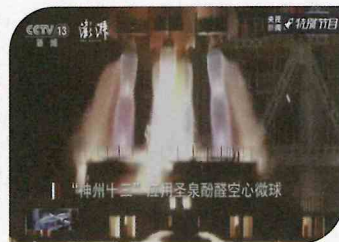
聖泉集団が生産したフェノール中空微小球を神舟十三号帰還カプセルに使用し