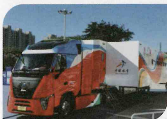
北京冬季オリンピックで中国重汽が自主開発した雪蟻車

龍山人工知能谷、龍山デジタル経済産業園、山大地緯ソフトウェア、百度智算センターなどの情報科学技術プラットフォームとプロジェクトを頼りに、センサー、人工知能、クラウドコンピューティングなどの分野の戦略新興産業の育成を加速させる。