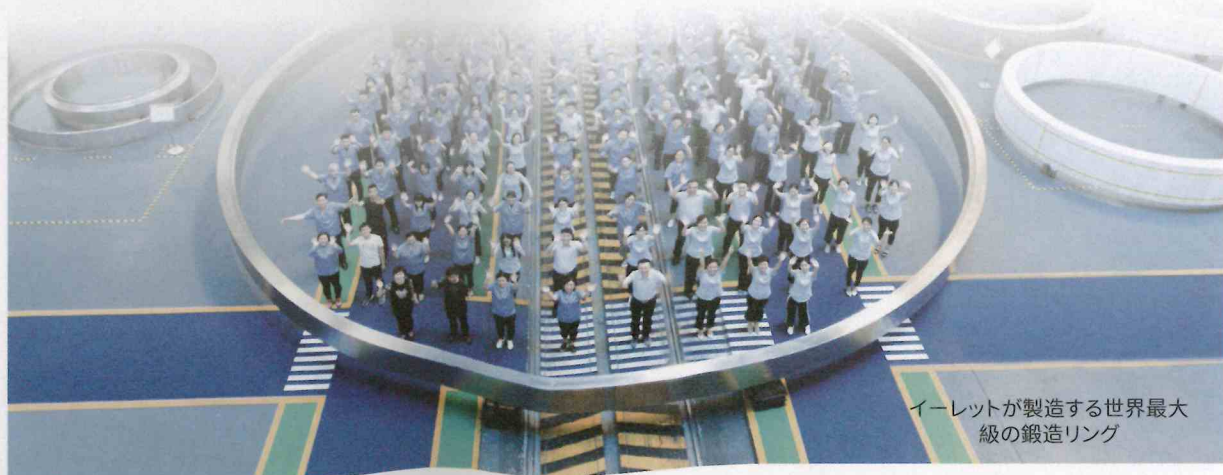
イーレットが製造する世界最大級の鍛造リング