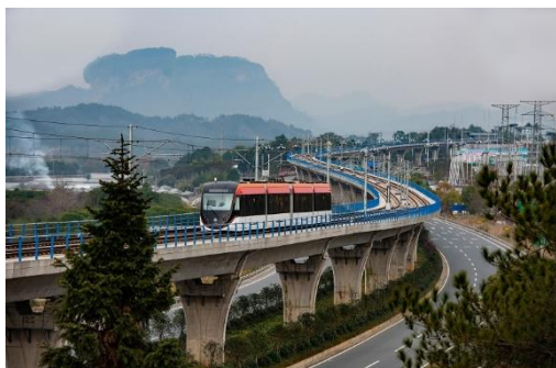
アモイ郊外の軌条鉄道

1 万トン以上の大型船の泊地は 198 カ所ある。1 億トン以上の取り扱い可能港は 3 か所。2022 年の貨物取扱量は 7.14 億トンで、標準コンテナ換算で 1800 万 TU になる。島嶼部が多いことから、500 人以上の居住がある島とは定期便、100 人以上の島には旅客埠頭を建設している。