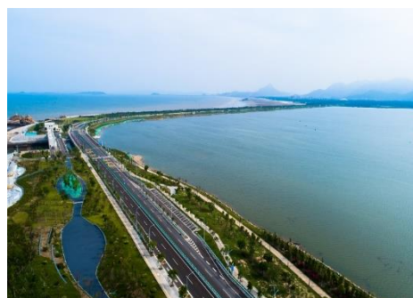
島嶼部をつなぐ大型幹線道路