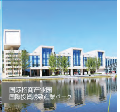
国际招商产业园 國際投資誘致産業パーク