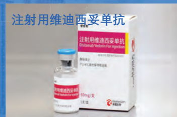
注射用维迪西妥单抗

目前现有重点在研药械产品49种，其中一类新药14种，今后每年将有1-2种创新药上市 現時点では重点的に研究している医療機器商品は49種あり、そのうち、一類新薬は14種占めている。今後も毎年1-2種の新薬が販売する予定である