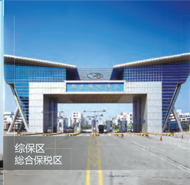
综保区 綜合保稅区