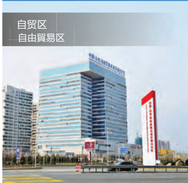
自贸区 自由貿易区