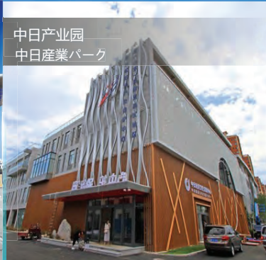
中日产业园 中日産業パーク