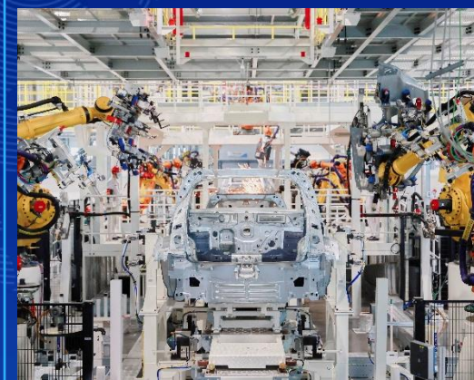
科技创新中心 科学技術イノベーションの中心地