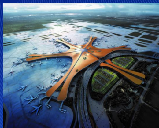
国际交往中心 交際交流の中心地