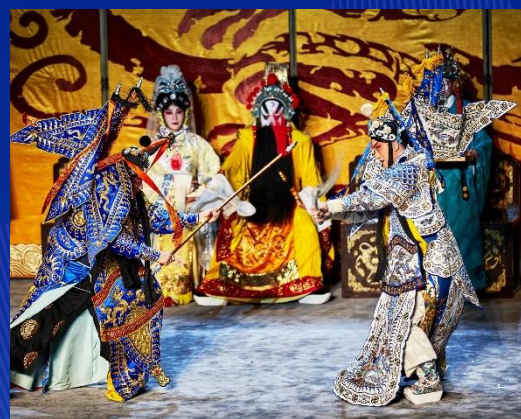
文化中心 文化中心