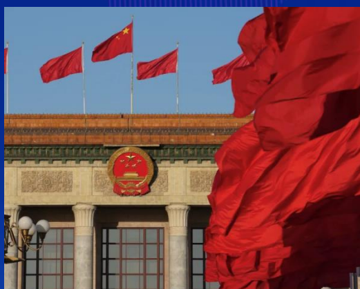
政治中心 政治中心

国際的ハイエンド要素が集中し、優れた金融要素が揃い 科学技術人材のメリットが目立ち、インフラ整備とパブリックサービスが完ぺき