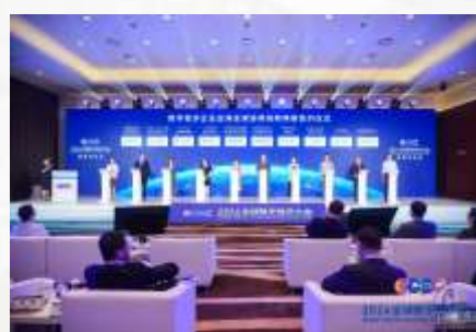
企业出海全球协同创新网络签约