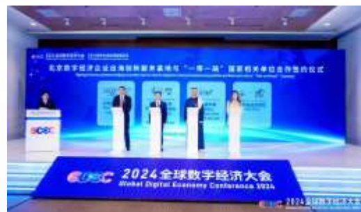
与沙特等中东国家相关单位签约