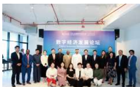
全球数字经济大会 阿联酋分会场