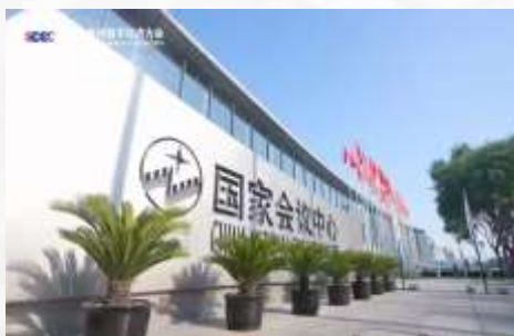
数字生态出海发展论坛