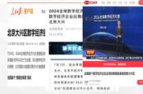
10余家知名媒体报道