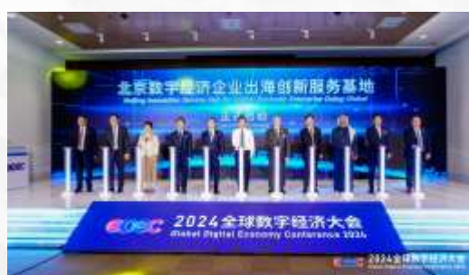
出海基地启动仪式