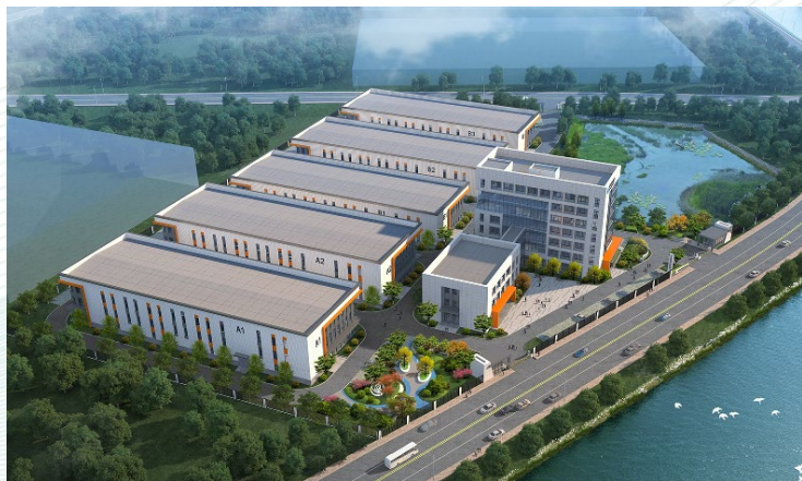
栖霞市投资促进中心