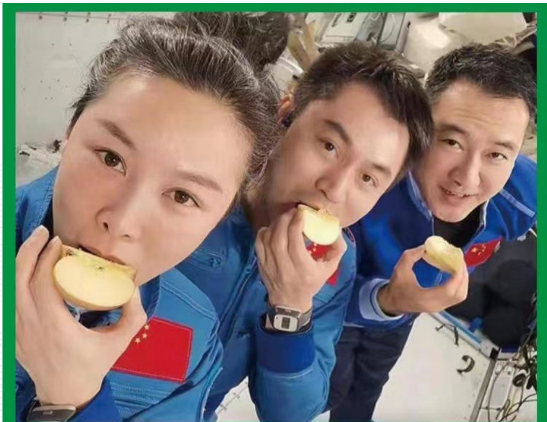
中国苹果从《豹山口》飞上天空，航天员英雄在空间站品尝栖霞苹果—烟台苹果享誉太空