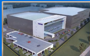
大福自动搬送设备项目 大福自動搬送装置 プロジェクト