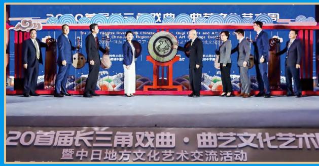
中日长三角地方文化艺术交流活动 中日長江デルタ地方文化芸術交流イベント