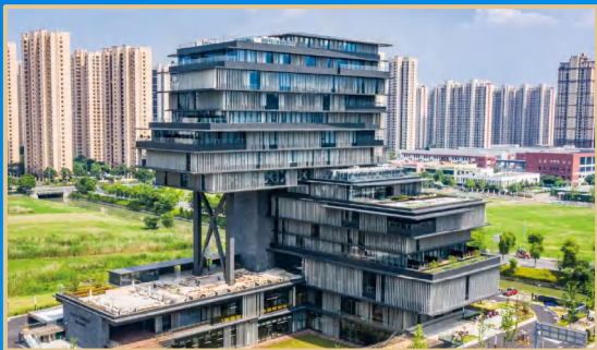
苏州悦季元来酒店（松下独步设计） 蘇州悦季元来ホテル（松下独歩デザイン）