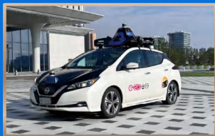
日产出行服务 日産モビリティサービス

举办中日地方发展合作活动超 130场 ↑ 中日地方発展協力イベントを130回以上実施