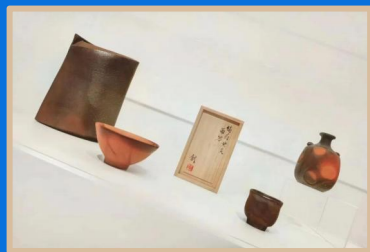
备前烧展示会 備前焼展示会

「国際職人伝承地・江南芸術新蟹郷」と位 置づけ、国際的な文化体験、グルメ、親子 旅行のリゾート地を目指す