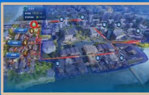
三菱重工智慧能源项目 三菱重工スマート エネルギープロジェクト