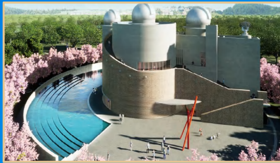
中日友好天文台（安藤忠雄设计） 中日友好天文台（安藤忠雄デザイン）