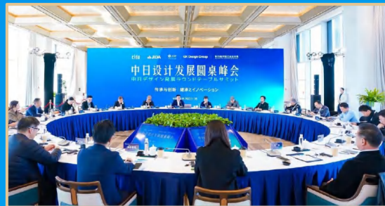
举办中日设计发展圆桌峰会 中日デザイン発展ラウンドテーブルサミットを開催