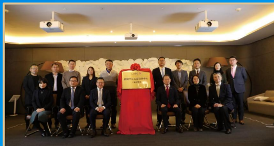
中日工业设计中心上海分中心成立 中日工業デザインセンター上海センターを設立