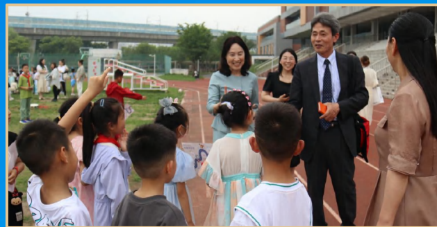
长野县下松川中央小学校代表来访相城 長野県下松川中央小学校代表団が相城を訪問