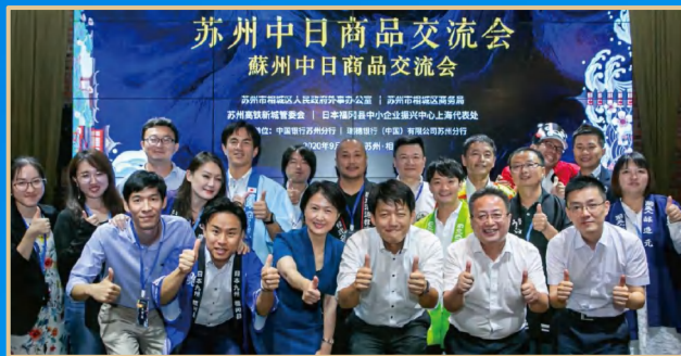
苏州中日文化与商品交流会 蘇州中日文化と商品交流会