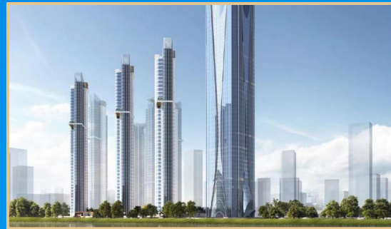
新加坡丰隆集团超高层综合体（丹下建筑事务所设计） シンガポール豊隆超高層ビル（丹下建築事務所デザイン）