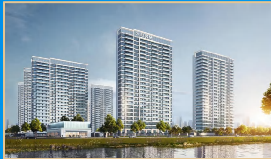
大和房屋 大和ハウス