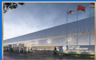
IHI离心式压缩机项目 IHI遠心圧縮機 プロジェクト