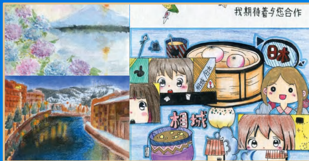
中日画信 中日絵手紙