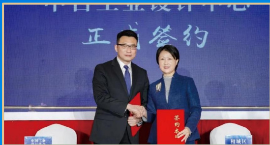
中日工业设计中心 中日工業デザインセンター