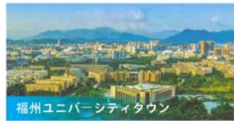
福州ユニバーシティタウン