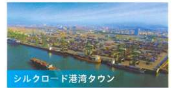
シルクロード港湾タウン