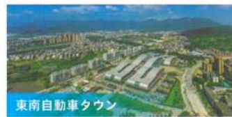
東南自動車タウン