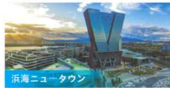
滨海ニュータウン

「六つの団地」の建設を通して都市圏におけるイノベーションチェーンと産業チェーンの深き融合を強化し、都市の競争力、革新力、影響力を高め続けます。