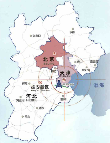
京津冀战略合作示意图 北京天津河北战略合作イメージ図