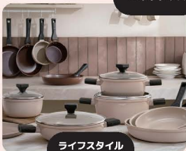
ライフスタイル 雑貨