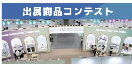
出展商品コンテスト