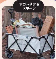
アウトドア & スポーツ

中国・浙江省をはじめ 台湾とアジアの国・地域から 約1,000種類の商品が出展!