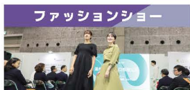
ファッションショー