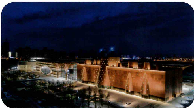
濱海新区文化センター