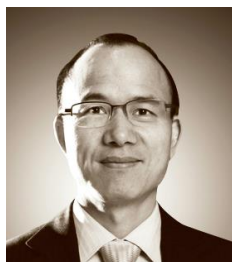
郭广昌 中国企业家俱乐部副理事长 复星集团董事长