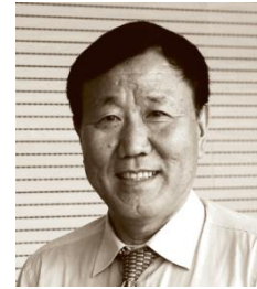
朱新礼 中国汇源果汁集团有限公司董事长