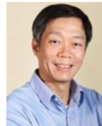
邝子平 启明创投创始人