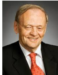
Jean Chrétien 加拿大前首相