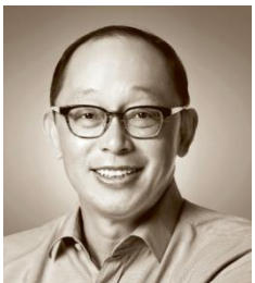
田溯宁 宽带资本董事长、亚信集团董事长