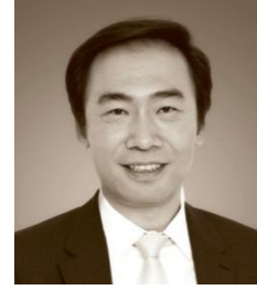
邓锋 北极光创投创始人、董事总经理