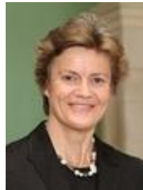
Barbara Woodward 英国驻中国大使