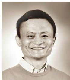
马云 中国企业家俱乐部主席 阿里巴巴集团董事局主席