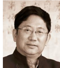
徐井宏 清华控股有限公司董事长