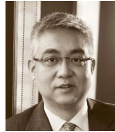
张懿宸 中信资本控股有限公司董事长兼首席执行官