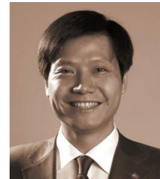
雷军 小米科技有限责任公司创始人、董事长兼首席执