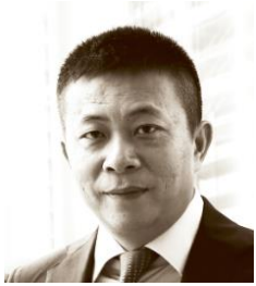
曹国伟 新浪董事长兼首席执行官