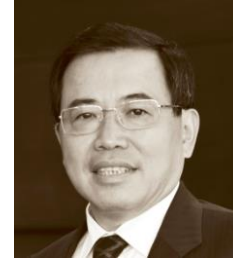
李东生 TCL 集团股份有限公司董事长兼首席执行官