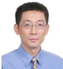
施一公博士 中国科学院院士 清华大学生命科学学院院长