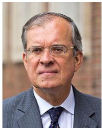
Maurice Gourdault-Montage 法国驻中国大使