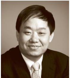
王玉锁 新奥集团股份有限公司董事局主席