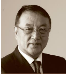
柳传志 联想控股股份有限公司董事长 联想集团有限公司创始人、名誉董事长