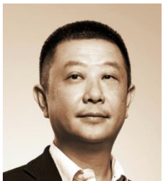
张勇 四川海底捞餐饮股份有限公司董事长