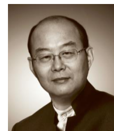
刘东华 中国企业家俱乐部创始人、副理事长 正和岛创始人兼首席架构师