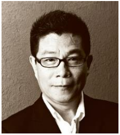
王中军 华谊兄弟传媒股份有限公司董事长兼首席执行官