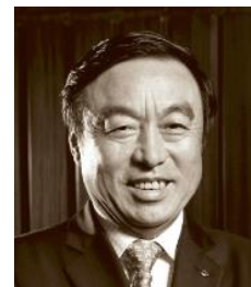
马蔚华 中国企业家俱乐部理事长 原招商银行行长