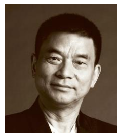
刘永好 中国企业家俱乐部副理事长 新希望集团董事长 中国民生银行副董事长