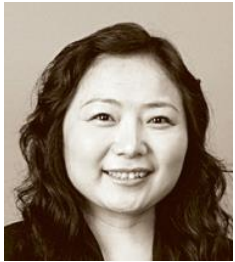
吴亚军 龙湖集团董事长