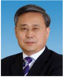
郭树清 山东省省长