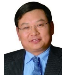
项兵 长江商学院教授及创办院长