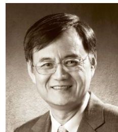
钱颖一 清华大学经济管理学院院长、教授