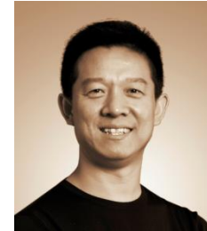
贾跃亭 乐视控股集团创始人、董事长兼首席执行官