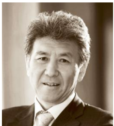
刘积仁 东软集团股份有限公司董事长兼首席执行官