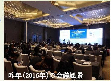
昨年(2016年)の会議風景